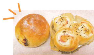
新商品!! 左からレーズンチーズパン、くるみチーズパン

新しい利用者や職員が加わり、HACCPによる衛生管理を徹底するため白衣も新調し、これまで以上に皆で力を合わせ、パン作りに励んでおります。また、パンの新商品作りにも挑戦しており、既に一部は4月から販売もしています(写真参照)。利用者が、販売を通して地域の皆様と触れ合う機会をたくさん設けますので、お見かけの際は、ぜひ宜しくお願い致します。