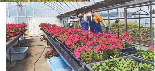
ペチュニアの苗を手入れしています