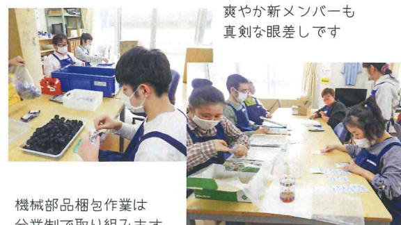
爽やか新メンバーも真剣な眼差しです

爽やかな風と共に新鮮な空気を運んでくれ、その新鮮な空気の中で刺激を受け、相手を思いやり助け合うといった微笑ましい行動が増えつつあります。その中で利用者がお互いに切磋琢磨し、一人一人が素敵な花を咲かせられるようにと私たちは願っています。