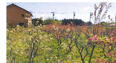
満開のブルーベリーの花

農園芸班は利用者12名、職員3名、全員男子で汗臭く作業しています。昨季はブルーベリー、だいこん、にんじん、じゃがいも、さつまいも、やまといも、パンジー、ビオラ、マリーゴールド、サルビア、ペチュニア、グリーンネックレス、切り干し大根、パチンコ台のリサイクルなどを手がけました。なんだかいろいろですね。