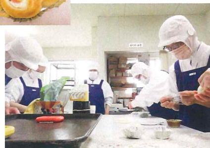
白衣が新しくなりました