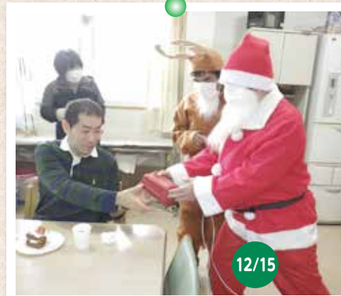
クリスマス会 サンタさんとトナカイさんにプレゼントをいただきました