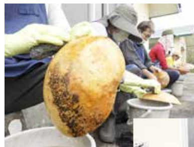
ふくべ洗いの作業風景

農園芸班では、昨季より郷土民芸品のふくべ洗いが、加わりました。四季の風情を感じ、春の暖かな太陽のひだまりを感じながら、ふくべ洗い。蝉の声を聞きながら、畑の除草作業。澄み渡る秋空の下での柿の収穫。白い息を吐きながら、梅、柿の剪定作業など、和気あいあい、作業に取り組んでいます。