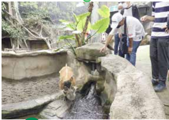
9/18 那須どうぶつ王国 秋晴れの那須で動物とふれあいました