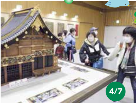
お花見 だいや川公園はあいにくのお天気で、「だいや体験館」を見学しました