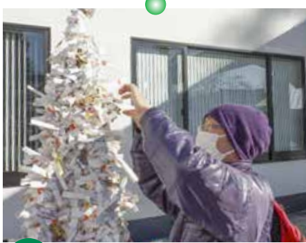
1/9 初もうで 安住神社で楽しい一年になるようお参りました