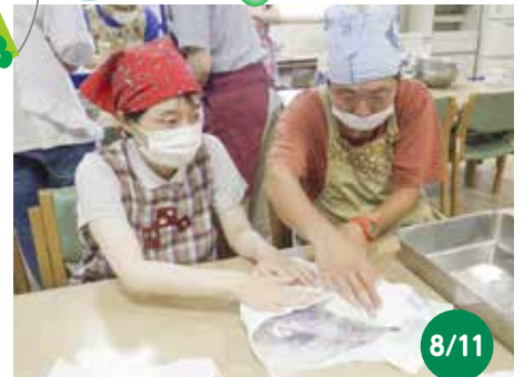
アイスクリーム祭り 農園芸班で収穫したブルーベリーでアイスクリームを作りました

コロナ禍も収まり始めたかに見えましたが、11月には感染拡大で閉所となり、予定していたながわ水遊園見学は中止になりました。残念。