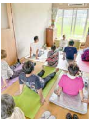
よつば荘でのヨガ教室の一コマ