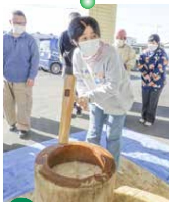
1/13 もちつき つぎたてのお餅を給食で食べました