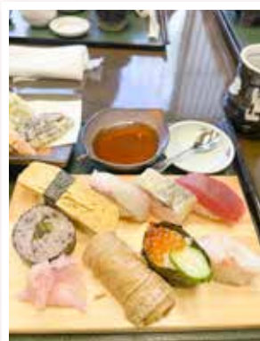
外食支援の楽しいひと時